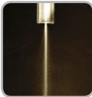
Ohne PremiumDiesel ecoDrive

Durch PremiumDiesel ecoDrive wird die Verbrennung optimiert: Die Gefahr der Düsenverkockung wird deutlich reduziert.