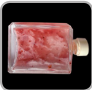
Ohne PremiumDiesel ecoDrive

Über die Tankbelüftung können schlamm bildende Mikroorganismen (Bakterien) in den Kraftstoff gelangen. Zusammen mit