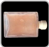
Mit PremiumDiesel ecoDrive