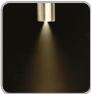
Mit PremiumDiesel ecoDrive